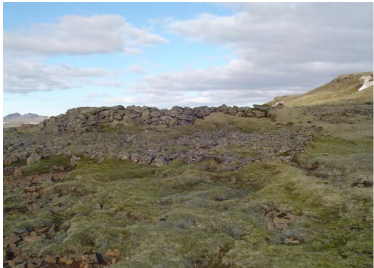
Húsarústir undir Hverahlíð. Horft til austurs.

Að síðustu skal nefna húsarústir ÁR-721:067 sem eru á dálitlum hjalla undir Hverahlíð, fast austan við hverasvæðið sem þar er, og hlíðin er kennd við. Annars vegar er um að ræða greinilegan sökkul undan húsi, hlaðinn úr grágryti og skiptist hann í fimm hólf eða herbergi. Einnig má greina hlaðnar “útidyratröppur” við norðvesturhorn rústarinnar. Hins vegar er um að ræða greinilega gólfplötu undan húsi sem einnig er gerð úr grágryti og er hún um 1,5 m vestan við fyrrnefndu bygginguna. Virðist sem þessi bygging hafi verið byggð yfir hver, því greinilega rýkur upp úr miðri plötunni. Að svo stöddu er ekki vitað um hlutverk þessara mannvirkja en líklega eru þau ung. Ljóst þykir að þau muni ekki koma til með að vera í hættu vegna borframkvæmdanna. Þó er lagt til að þau verði merkt vel til þess að taka af allan vafa um staðsetningu þeirra.