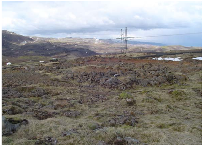
Horft til norðurs yfir Ölkelduhálsrétt.

er í raun á miðju hverasvæðinu sunnan við hann. Hvað sem því líður þá er ekki aðrar fornminjar að finna á þessu svæði. Engar fornleifar var heldur að finna á vestara borsvæðinu við Kýrgil.