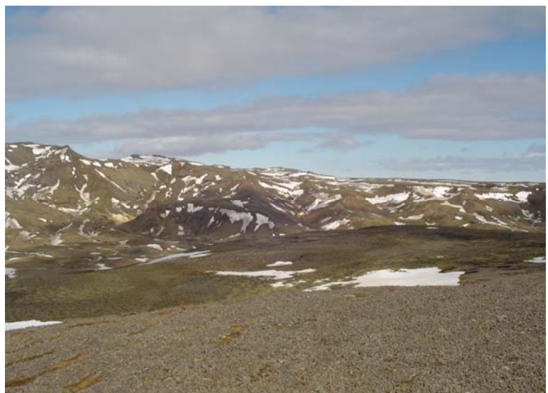
Horft til norðurs yfir fyrirhugað borsvæði á Stóra-Skarðsmýrarfjalli

Eftir rækilega athugun á heimildum og á vettvangi hefur komið í ljós að engar minjar er að finna á Stóra-Skarðsmýrarfjalli. Þar er að mestu uppblásinn melur, ísaldargrús að sunnan, en stórgrýttara að norðanverðu. Fjallið er að mestu gróðursnautt, einungis þunnir mosaflákar á stöku stað, einkum þó