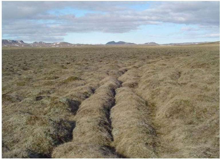
Suðurferðagata. Horft til austurs.

Suðurferðagata liggur á svipuðum slóðum og fyrirhugað borholustæði undir Hverahlíð og gæti því mögulega verið í hættu vegna framkvæmda þar. Leita verður leyfis hjá Fornleifavernd ríkisins ef nauðsynlegt þykir að raska leifum Suðurferðagötu.