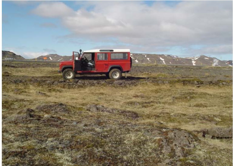
Gamli Hellisheiðarvegurinn. Horft í norður.

Fyrst skal nefna gamla Hellisheiðarveginn ÁR-721:061 sem er skammt suður af núverandi þjóðvegi. Hann er að stofni til frá 1894-5 7 og upphlaðinn á köflum. Þótt